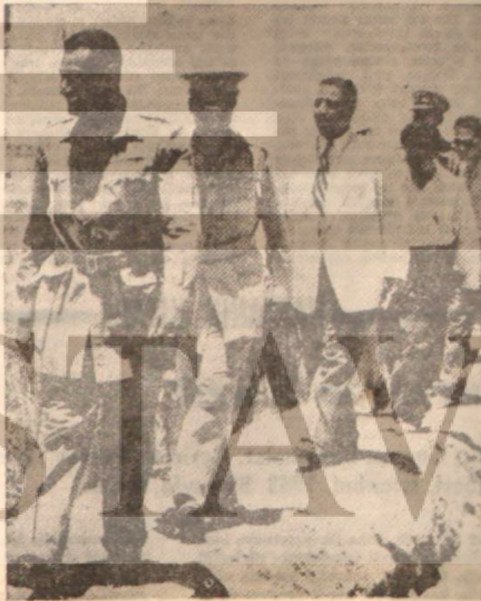
Nâsır, tarla sulama işini inceliyor

Nâsırın Mısır, sosyal hedefli askeri rejim tipinin tam bir ör-