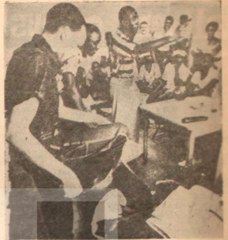
Zenciler bir ırk ayrımı nümâyesinde iş adamları çabuk ayıldı

Zenci liderler hafta sonunda Los Angeles'te toplanarak genel tesarrüze zamanını ve stratejilerini kararlaştıracaklar.