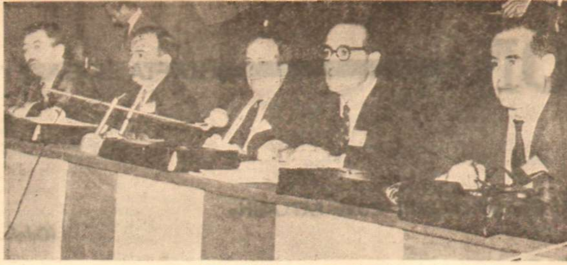
Odalar Birliği Genel Kurulu toplantısından görünüş