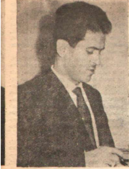
Fakir Baykurt Yılanların öcütü