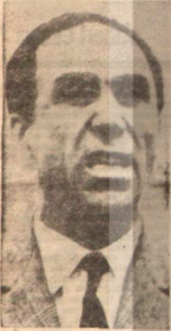
Lambrakis Muhalefetin kan davası

B ağımsız sol milletvekili Lambrakis'in öldürülmesi, Yunanistan'da bir buhrana yol açtı. Buna sebep polis, ölüm tehditlerine rağmen, Faşist gangsterlerin toplantı binası önüne yığılmalarına, sanki bir şey yokmuş gibi müsaade etmesi. Lambrakis'e saldırılmasından 15 dakika önce, EDA partisine mensup başka bir milletvekili polis gözleri önünde dövülüyor ve polis seyirci kalıyordu. Bundan cesaret alan faşist gangsterler, bir arabayı Lambrakis'in üzerine sürdüler ve onu, ölümüne sebep olacak şekilde çiğnediler. Polis, Lambrakis'e saldırı ölüm arabasını durdurmaya bile teşebbüs et