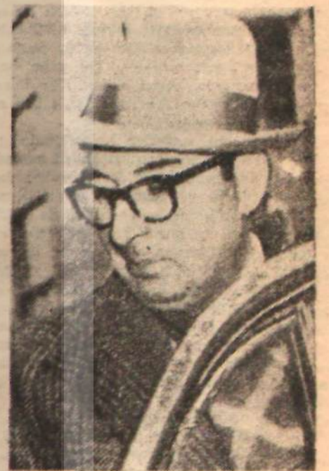
Turhan Feyzioğlu «Bize Rus kapısını çaldırmayın»

Merinos yetiştirilmesini teşvik amacıyla hükümet, iki yıl önce, yünün kilo fiyatını 32 lira olarak tesbit eder. Fakat kırpma mevsimi olan Nisanda dünya fiyatlarındaki düşüşü ileri sürerek, hükümet yün fiyatını 17 liraya indirir. Resmî ağalar, yünü satın almak için köye ancak son baharda gelir. Köylü ise acele paraya muhtaçtır. Para da, ağada vardır. Ama ağa nazıdır, «Bu iş rizikolu, ya hükümet bu sene yün almazsa, ya fiyatını daha düşürürse.» der. Netice ağanın fiyatı 7 liradır. Altı ay sonra ağa 7 liraya aldığı 17 liraya satar, kârı cebine atar. Başka bir örneği peynirlikten alalım. Peynir imalâtçısı hayvan sahibiyile bir anlaşma yapar. Hayvan yetiştiricisi, mevsim boyunca sütünü ona satacaktır. Süt fiyatı, süt teslimi bitince, yani, mevsim sonunda yapılır. Bu arada peynirci, hayvan sahibine avans verir. Mevsim sonunda fiyat tesbit edilince, peynir imalâtçısı, bu avanslar için yüzde 100 den yüzde 200 e