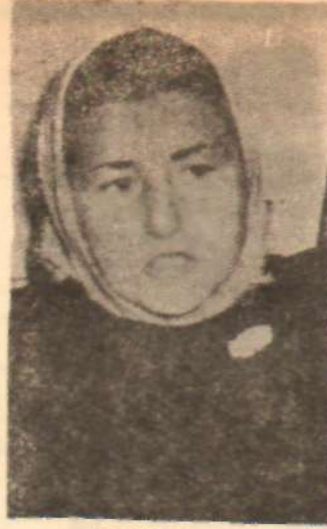
Tellal Fatma Korkudan konuşmıyor

Küçük yaştaki kızların zengin iş adamlarına satılmasıyla ilgili sosyal skandal, genel olarak, tek yönüyle ilerliyor. Genç kız ticareti rezaletinin asıl suçluları zengin iş adamları, bu konudaki «gizli yatırım»larına devam ediyorlar. Genç kızlar ise adliyeye getiriliyor, duruşmalara çıkarılıyorlar. Gazetelerde boy boy resimleri ve söyledikleri sözlerle teşhir ediliyorlar. Bazı vicdan sahibi basın mensupları; bu küçük kızların yayınladıkları resimlerini gözlerine, gayet ince banlar koyarak, ahlaki ve mesleki görevlerini yerine getiriyorlar.. Olmanın sadece yüzeyinde olarak, kalantor zamparaların isim ve cisimlerine dokunmadan, kirletilen körpe kızları teşhire büyük bir vicdan huzuru içersin de devam ediyorlar. Artık duruma iyiden iyiye alışan küçük yaştaki satılık kızlar da, adliye koridorlarında gazetecilere büyük iş adamları ve politikacılar gibi beyanatlara veriyorlar.